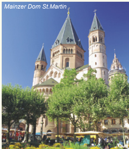
Mainzer Dom St.Martin

Genießen Sie heute die kurze Radetappe entlang des Altrheins, vorbei an herrlichen Seen und erreichen danach die Quadratestadt Mannheim, die aufgrund ihrer Straßenanordnung ihren Beinamen erhalten hat. Das Barockschloss – die größte barocke Schlossanlage Deutschlands und der Wasserturm – das Wahrzeichen der Stadt, zählt zu den bekanntesten Sehenswürdigkeiten. (ca. 20 km)