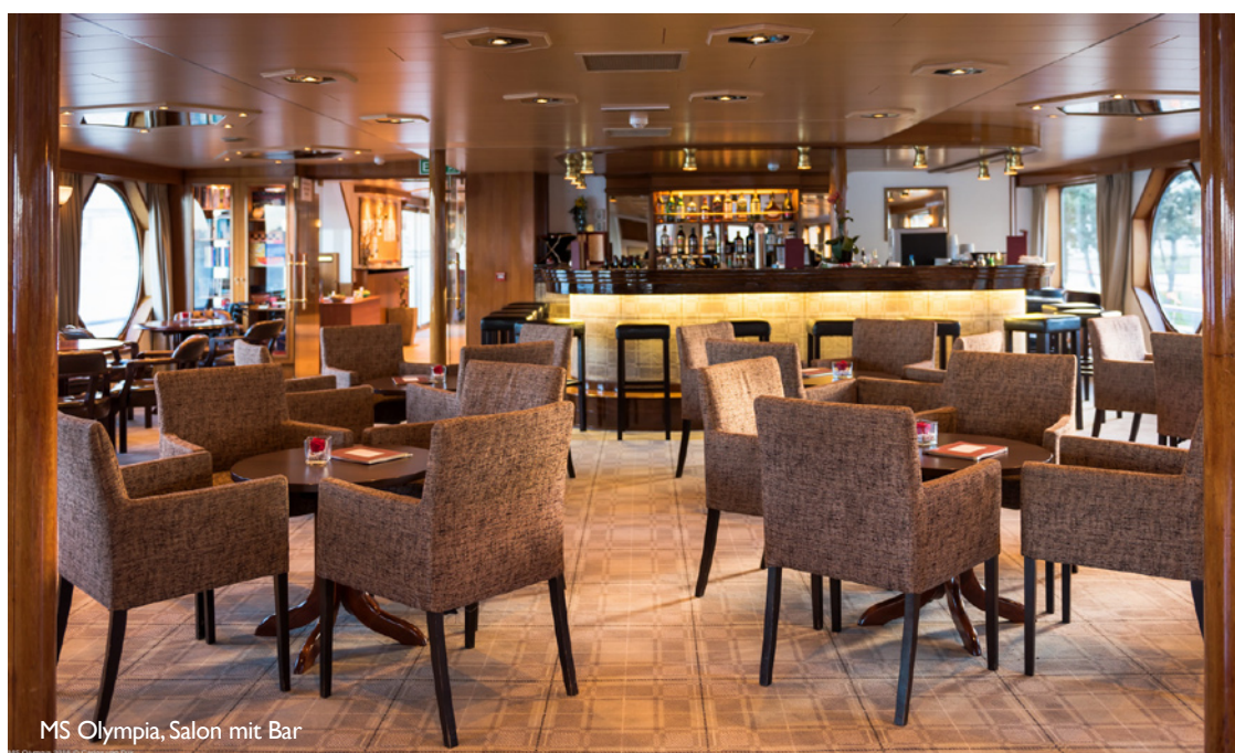
MS Olympia, Salon mit Bar