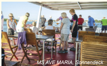
MS AVE MARIA, Sonnendeck

Die Tour kann auch von Venedig nach Mantua gebucht werden (siehe Termine).