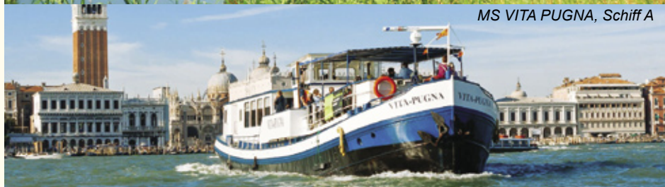
MS VITA PUGNA, Schiff A

Die MS VITA PUGNA oder die MS AVE MARIA ist Ihr Hotel am Po-Radweg, der entlang der Flüsse Mincio und Po durch weitgehend unberührte, ländliche Gebiete führt und schließlich die Lagune von Venedig erreicht.