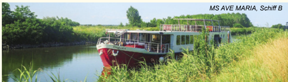
MS AVE MARIA, Schiff B

Flusskreuzfahrt mit MS MS AVE MARIA oder MS VITA PUGNA Mantua - Venedig oder Venedig - Mantua