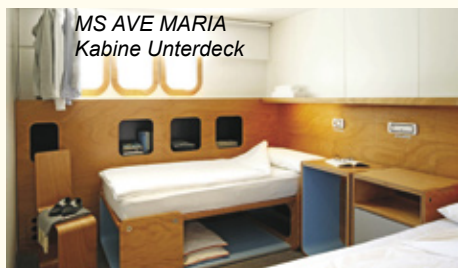
MS AVE MARIA Kabine Unterdeck

Nach dem Frühstück radeln Sie Richtung Ferrara in's historische Zentrum mit dem mächtigen