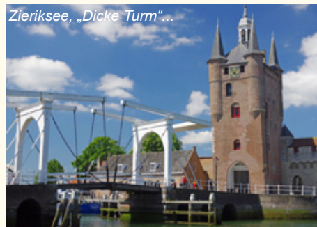
Zierikzee, „Dicke Turm“...

Radtour zum „Watersnoodmuesum“. Hier erfahren Sie alles zur großen Flutkatastrophe 1953 und zum „ertrunkenen“ Dorf Viane, das überschwemmt und nie wieder aufgebaut wurde. Weiter in Richtung Zierikzee, zum historischen Zentrum und über die Zeelandbrug - eine imposante Brücke von 5 km Länge, erbaut auf 54 Pfeilern - und nach Veere, einem beschaulichen Hafenstädtchen auf der Halbinsel Walchen (ca. 60 km)