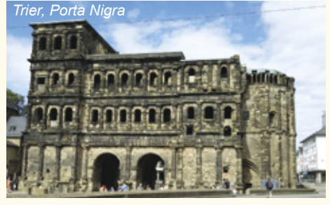
Trier, Porta Nigra

Diese Reise ist eine RadelReisen-Partnertour.