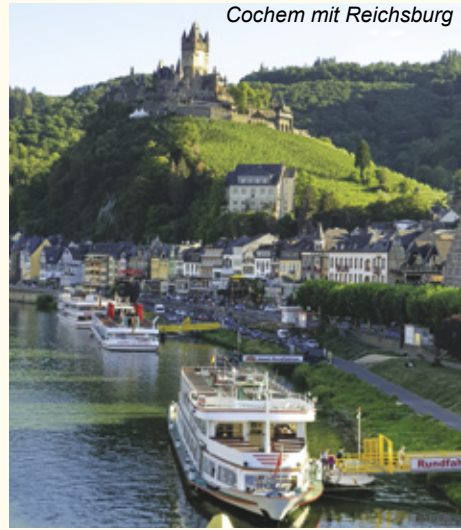
Cochem mit Reichsburg

1.Tag: Koblenz , Einschiffung ab 16 :00 Uhr. 2.Tag: Koblenz - Moselkern - Cochem Schiffahrt nach Alken und Radeltour nach Moselkern und weiter nach Cochem. In Cochem thront über allem wie ein Märchenschloss die Reichsburg. (ca. 30 km)