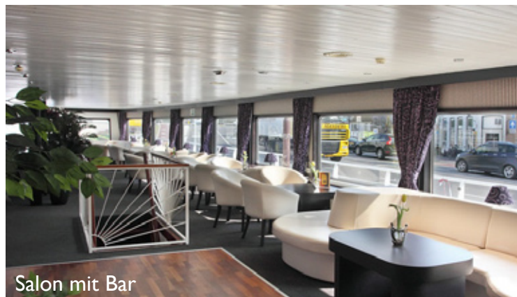
Salon mit Bar