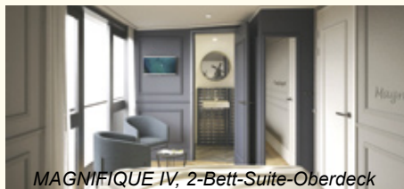
MAGNIFIQUE IV, 2-Bett-Suite-Oberdeck

Schiffahrt über den Schelde-Rhein-Kanal zu den imposanten Kreekrak-Schleusen. Radtour durch das Waldgebiet "Wouwse Plantage" nach Tholen, wo sie wieder an Bord gehen und nach Dordrecht, eine der ältesten Städte der Niederlande, fahren. (ca. 36 oder 20 km)