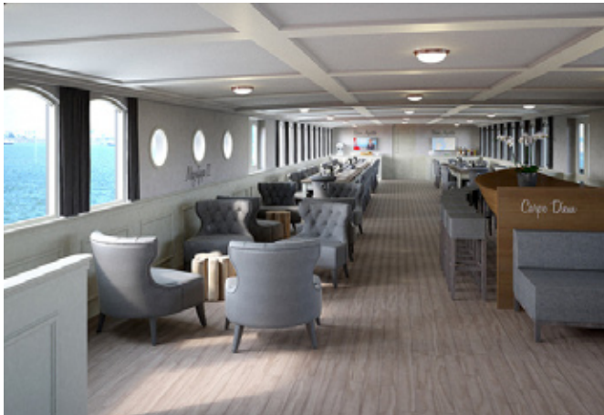
Salon mit Restaurant