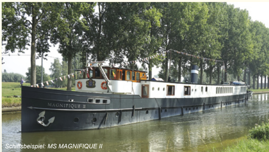
Schiffsbeispiel: MS MAGNIFIQUE II

Brügge - Amsterdam oder Amsterdam - Brügge mit den Premiumschiffen MS MAGNIFIQUE II, III oder IV