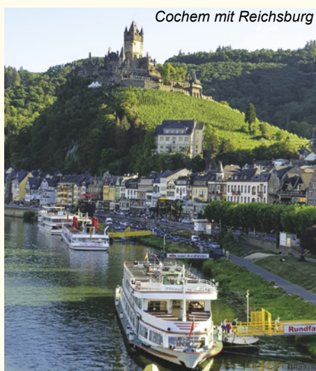
Cochem mit Reichsburg