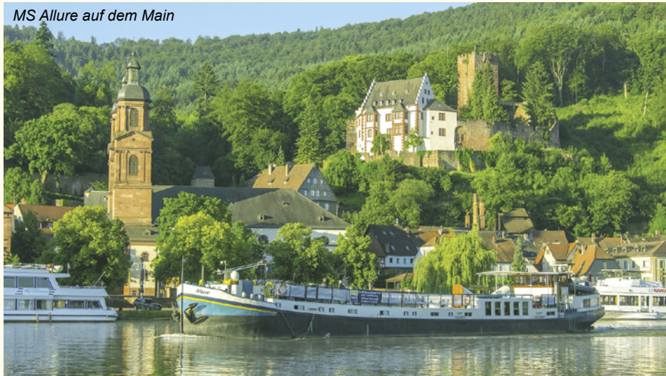
MS Allure auf dem Main

Die MS Allure bringt Sie in das Frankenland, eine Region hervorragender Weine, sagen die einen, wieder andere loben eher die Frankenbiere! So haben Sie auf dieser Reise immer wieder Gelegenheit, edle Tropfen, süffige Biere und kulinarische Genüsse zu probieren. Freuen Sie sich auch auf herrliche Altstädte, denn auch die Augen wollen verwöhnt werden!