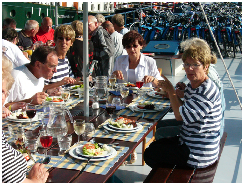
Gäste an Deck