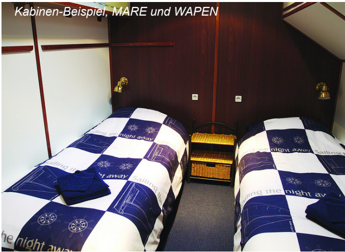
Kabinen-Beispiel, MARE und WAPEN