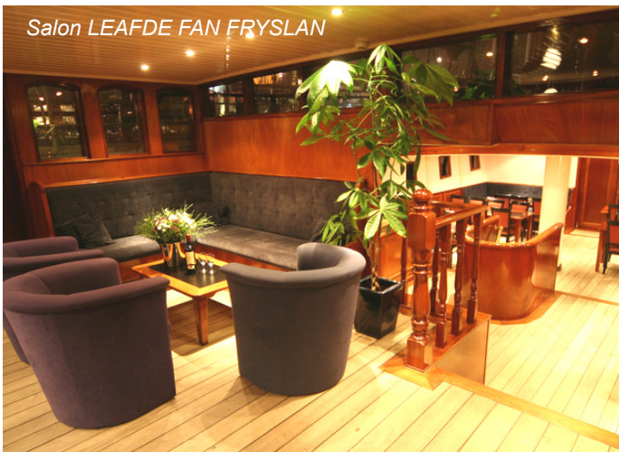
Salon LEAFDE FAN FRYSLAN