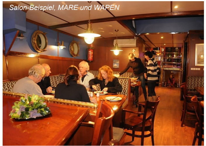
Salon-Beispiel, MARE und WAPEN