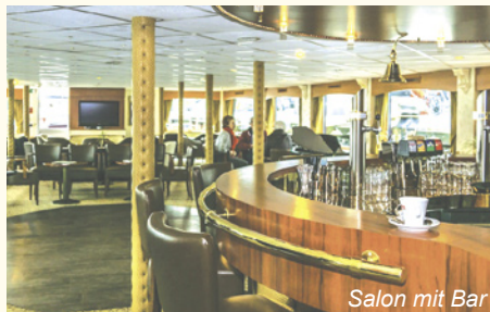
Salon mit Bar

besitzt einen der größten Häfen an der Ostsee. Ihre Altstadt ist Standort des rekonstruierten Schlosses der Herzöge von Pommern. (ca. 30 km)