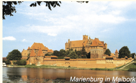
Marienburg in Malbork

Besichtigung in Płock und Radeltour entlang der Weichsel zu dem bekannten Kurort – Ciechocinek, wo Sie die Gradierwerke und Kuranlagen besichtigen. Kurzer Bustransfer nach Toruń/Thorn, der Geburtsstadt von Nikolaus Kopernikus. Stadtführung durch die Altstadt sowie Besichtigung der Marienkirche und der Johanneskirche. Abendessen in einem gemütlichen Restaurant in der Altstadt in Toruń. (ca. 40 km)