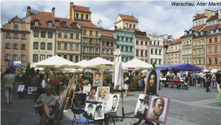
Warschau, Alter Markt