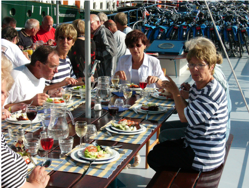
Gäste an Deck