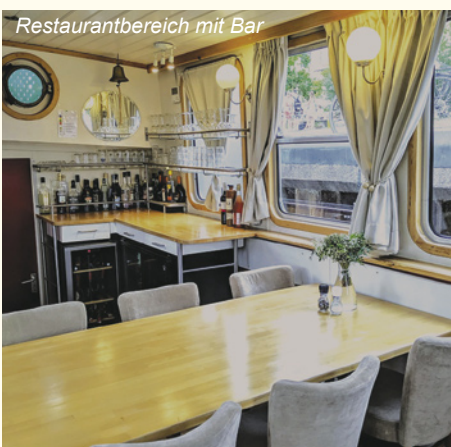
Restaurantbereich mit Bar