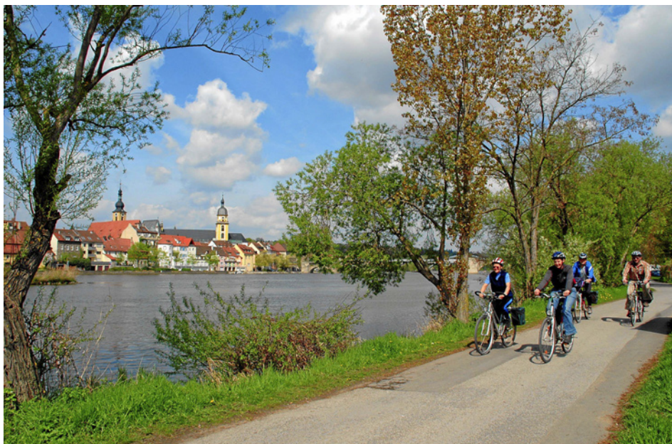
Radler bei Kitzingen am Main