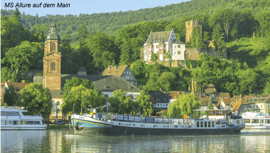
MS Allure auf dem Main

Die MS Allure bringt Sie in das Frankenland, eine Region hervorragender Weine, sagen die einen, wieder andere loben eher die Frankenbiere! So haben Sie auf dieser Reise immer wieder Gelegenheit, edle Tropfen, süffige Biere und kulinarische Genüsse zu probieren. Freuen Sie sich auch auf herrliche Altstädte, denn auch die Augen wollen verwöhnt werden!