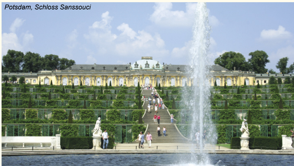
Potsdam, Schloss Sanssouci

Theodor Fontane hat im 19. Jahrhundert seine brandenburgische Heimat durchwandert. Mit dem Fahrrad folgen Sie seinen Spuren durch die Mark Brandenburg. Dabei erleben Sie den naturnahen Lauf der Havel und durchradeln das weite Havelland. In Potsdam und Brandenburg treffen Sie auf viele Zeugnisse der brandenburgisch-preußischen Geschichte.