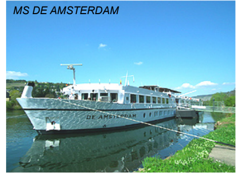
MS DE AMSTERDAM

Abfahrten Südroute zwischen dem 31.03. und dem 04.05.19: Am Donnerstag besteht die Möglichkeit, die berühmte Tulpenausstellung "Keukenhof" bei Lisse zu besuchen (mit Bus/Bahn oder ggf. teilweise mit Rail+Bike; Kosten der Fahrt und Eintrittspreis „Keukenhof“ nicht inklusive).