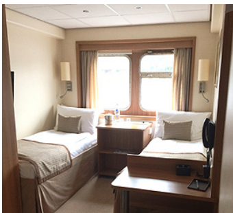
MS DE AMSTERDAM, 2-Bett Unterdeck