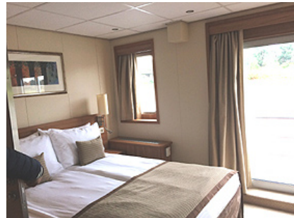
MS DE AMSTERDAM, Suite Oberdeck