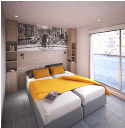
MS DE HOLLAND, Suite Oberdeck