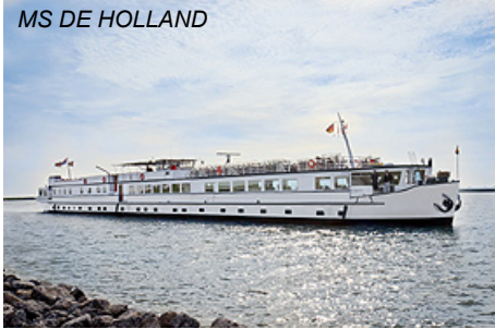
MS DE HOLLAND