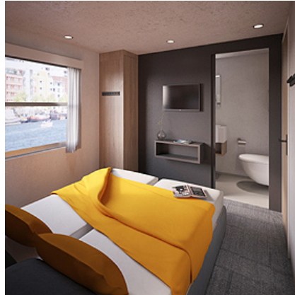
MS DE HOLLAND, 2-Bett-Kabine Unterdeck